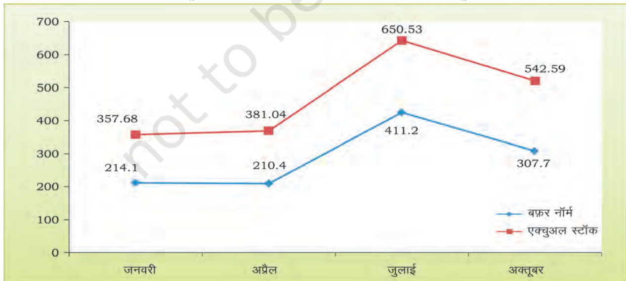
आरेख 4.2 : न्यूनतम बफ़र स्टॉक का स्तर (करोड़ टन) एवं चावल और गेहूँ के मानक

स्रोत : भारतीय खाद्य निगम, 2019; बफ़र स्टॉक का स्तर 1 जुलाई 2017 से माननीय है