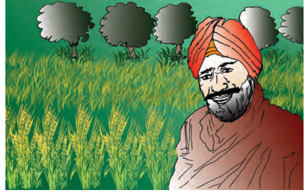
चित्र 4.3 : पंजाब का एक किसान एच.वाई.वी. प्रकारों वाले गेहूँ के एक खेत के सामने, जिस पर हरित क्रांति आधारित है

तत्कालीन प्रधानमंत्री इंदिरा गांधी ने जुलाई, 1968 में 'गेहूँ क्रांति' शीर्षक से एक विशेष डाक टिकट जारी कर कृषि के क्षेत्रक में हरित क्रांति की प्रभावशाली प्रगति को आधिकारिक रूप से दर्ज किया। गेहूँ की सफलता के बाद चावल के क्षेत्र में इस सफलता की पुनरावृत्ति हुई। बहरहाल, अनाज की उपज में वृद्धि समानुपातिक नहीं थी। उत्तर प्रदेश और मध्य प्रदेश में