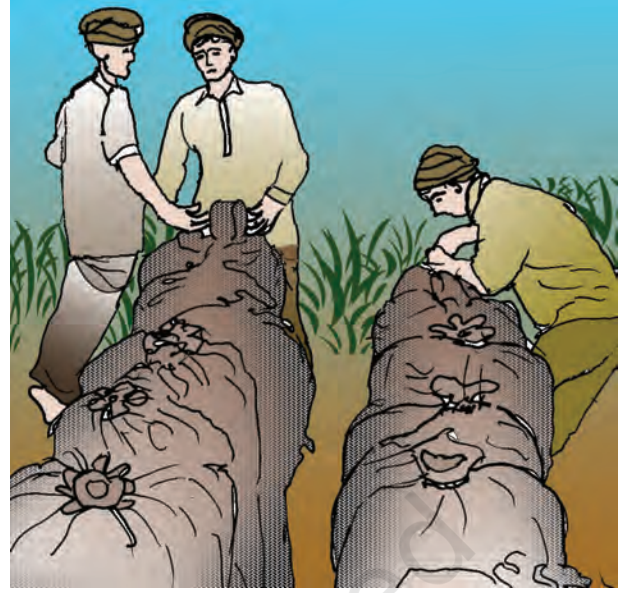
चित्र 4.5 : भंडारों में खाद्यान्न ले जाते हुए किसान

एन.एस.एस.ओ. न. 558 की रिपोर्ट के अनुसार ग्रामीण भारत में प्रति व्यक्ति चावल की खपत 6.38 किग्रा. वर्ष 2004-05 से घटकर 5.98 किग्रा. वर्ष 2011-12 में हो गया।