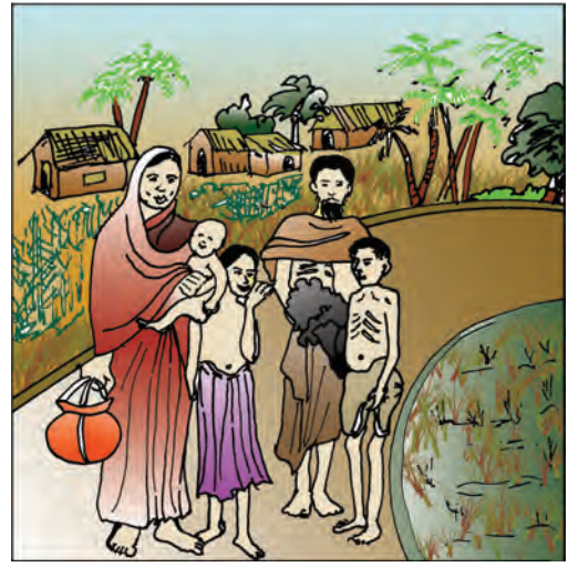
चित्र 4.2 : 1943 के बंगाल के अकाल के दौरान पूर्वी बंगाल के चटगाँव जिले में गाँव छोड़ कर जाता हुआ एक परिवार।