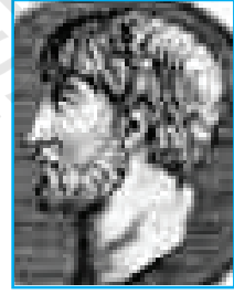
पियरे डि फर्मा (1601–1665) आकृति 15.2