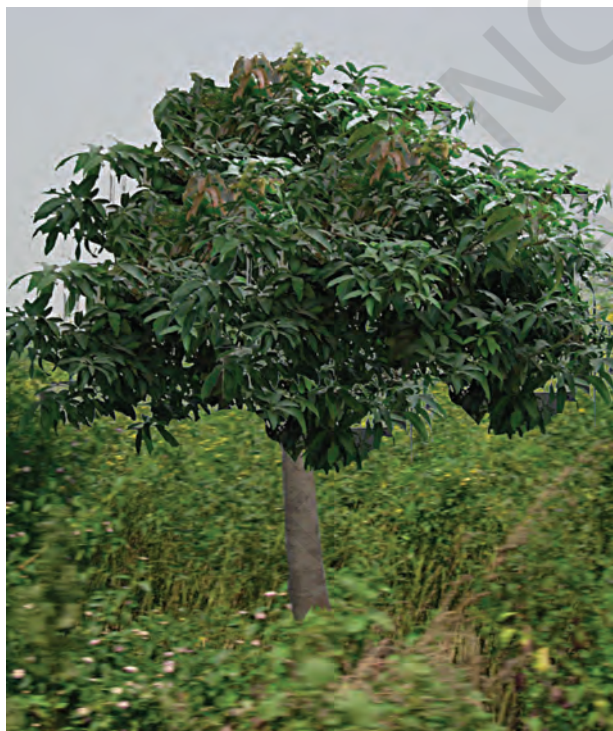
चित्र 7.3(a) : जंगली आम।