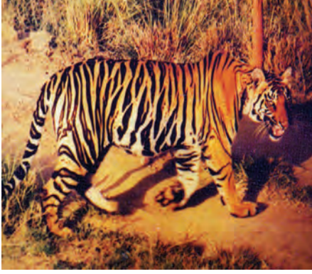
चित्र 7.4 : बाघ।