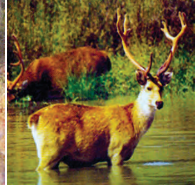
चित्र 7.6 : बारहसिंघा।