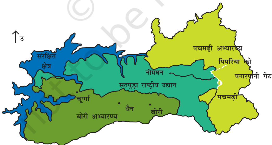
चित्र 7.1 : पचमढ़ी जैवमण्डल आरक्षित क्षेत्र।