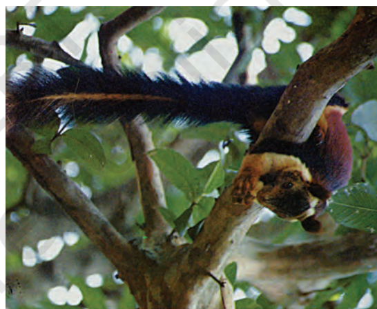
चित्र 7.3(b) : विशाल गिलहरी।