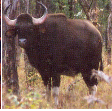
चित्र 7.5 : जंगली भैंसा।