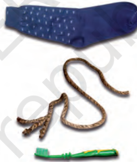
चित्र 3.3 : नाइलॉन से निर्मित विभिन्न वस्तुएँ।

हम नाइलॉन से निर्मित कई वस्तुओं को उपयोग में लाते हैं, जैसे— जुराबें, रस्से, तम्बू, दाँत साफ़ करने का ब्रुश, कारों की सीट के पट्टे, स्लीपिंग बैग (शयन थैला), परदे, आदि (चित्र 3.3)। नाइलॉन का उपयोग पैराशूट