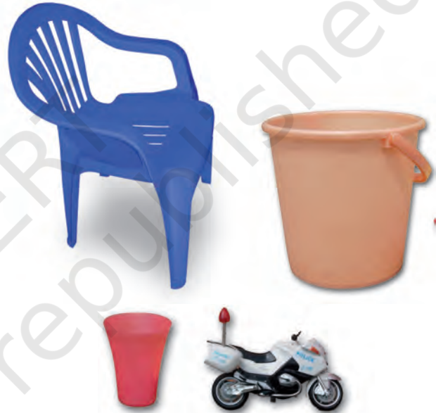
चित्र 3.7 : प्लास्टिक-निर्मित विभिन्न वस्तुएँ।

प्लास्टिक की वस्तुएँ सभी सम्भव आकारों और साइज़ों में उपलब्ध हैं, जैसा आप चित्र 3.7 में देख सकते हैं। क्या आपको आश्चर्य नहीं होता कि यह कैसे संभव है? तथ्य यह है कि प्लास्टिक आसानी से साँचे में ढाला जा सकता है अर्थात् इसे कोई भी आकार दिया जा सकता है। प्लास्टिक का पुनः चक्रण हो सकता है, इसे पुनः प्रयुक्त किया जा सकता है, इसे रँगा और पिघलाया जा सकता है, इसे बेलकर चद्दरों में बदला जा सकता है अथवा इसकी तारें बनायी जा सकती हैं। इसलिए इनके इतने विभिन्न प्रकार के उपयोग हैं।