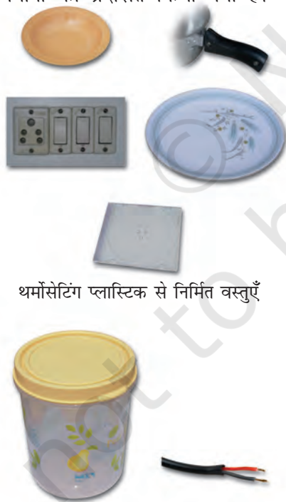
थर्मोसेटिंग प्लास्टिक से निर्मित वस्तुएँ

दूसरी ओर, कुछ प्लास्टिक ऐसे हैं जिन्हें एक बार साँचे में ढाल दिया जाता है तो इन्हें ऊष्मा देकर नर्म नहीं किया जा सकता। ये थर्मोसेटिंग प्लास्टिक कहलाते हैं। दो उदाहरण हैं - बैकेलाइट और मेलामाइन। बैकेलाइट ऊष्मा और विद्युत का कुचालक है। यह बिजली के स्विच, विभिन्न बर्तनों के हथ्थे, आदि बनाने में काम आता है। मेलामाइन एक बहुउपयोगी पदार्थ है। यह आग का प्रतिरोधक है तथा अन्य प्लास्टिक की अपेक्षा ऊष्मा को सहने की अधिक क्षमता रखता है। यह फर्श की टाइलें, रसोई के बर्तन और कपड़े बनाने के उपयोग में लिया जाता है जो आग का प्रतिरोध करते हैं। चित्र 3.8 में थर्मोप्लास्टिक और थर्मोसेटिंग प्लास्टिक के विभिन्न उपयोगों को प्रदर्शित किया गया है।