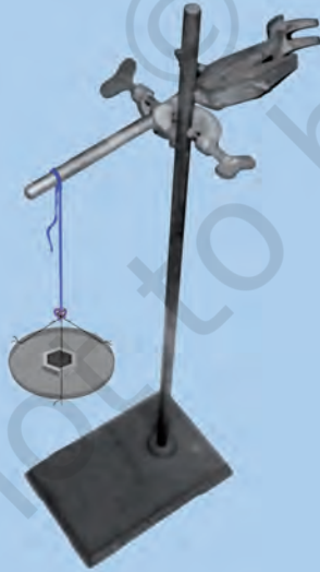
चित्र 3.5 : एक लोहे के स्टैंड पर क्लैम्प से लटकता हुआ एक धागा।

एक क्लैम्प युक्त लोहे का स्टैंड लीजिए। लगभग 60 सेमी लम्बा एक सूती धागा लीजिए। इसे क्लैम्प से बाँध दीजिए जिससे यह स्वतंत्र रूप से लटक जाए, जैसा चित्र 3.5 में प्रदर्शित है। मुक्त सिरे पर