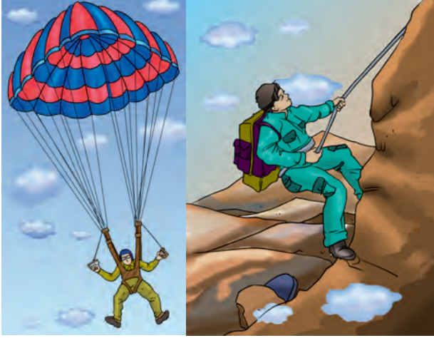
चित्र 3.4 : नाइलॉन रेशों के उपयोग।