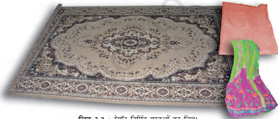
चित्र 3.2 : रेयॉन निर्मित वस्तुओं का चित्र।

आपने कक्षा VII में पढ़ा है कि रेशम कीट से प्राप्त किया जाता है। इसकी खोज चीन में हुई थी और इसे लम्बे समय तक कड़ी सुरक्षा में गोपनीय रखा गया। रेशम रेशे से प्राप्त कपड़ा बहुत मँहगा होता है परन्तु इसकी सुन्दर बुनावट (texture) ने प्रत्येक व्यक्ति को मोह लिया। रेशम को कृत्रिम रूप से बनाने के प्रयास किये गए। उन्नीसवीं शताब्दी के अन्तिम छोर पर वैज्ञानिकों को रेशम समान गुणों वाले रेशे प्राप्त करने में सफलता प्राप्त हुई। इस प्रकार का रेशा काष्ठ लुगदी के रासायनिक उपचार से प्राप्त किया गया। यह रेशा रेयॉन अथवा कृत्रिम रेशम कहलाया। यद्यपि रेयॉन प्राकृतिक स्रोत काष्ठ लुगदी से प्राप्त किया जाता है, यह एक मानव निर्मित रेशा है। यह रेशम से सस्ता होता है परन्तु इसे रेशम रेशों के समान बुना जा सकता है। इसे रंगों की कई किस्मों में रँगा जा सकता है। रेयॉन को कपास के साथ मिलाकर बिस्तर की चादरें बनाते हैं अथवा ऊन के साथ मिलाकर कालीन या गलीचा बनाते हैं। (चित्र 3.2)।