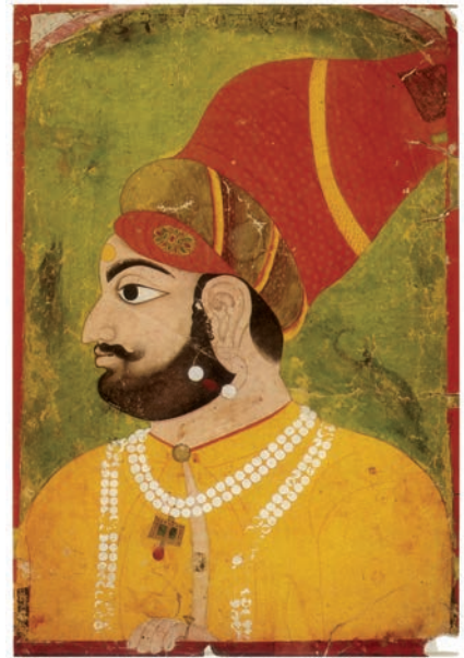
चित्र 4 बीकानेर के राजकुमार राजसिंह

ये सांस्कृतिक परंपराएँ वहाँ के शासकों के आदर्शों तथा अभिलाषाओं के साथ घनिष्ठता से जुड़ी हुई थीं। लगभग आठवीं शताब्दी से आज के राजस्थान के अधिकांश भाग पर विभिन्न परिवारों के राजपूत राजाओं का शासन रहा। पृथ्वीराज (अध्याय 2) एक ऐसा ही शासक था। ये शासक ऐसे शूरवीरों के आदर्शों को अपने हृदय में संजोए रखते थे, जिन्होंने रणक्षेत्र में बहादुरी से लड़ते हुए अकसर मृत्यु का वरण किया, मगर पीठ नहीं दिखाई। राजपूत शूरवीरों