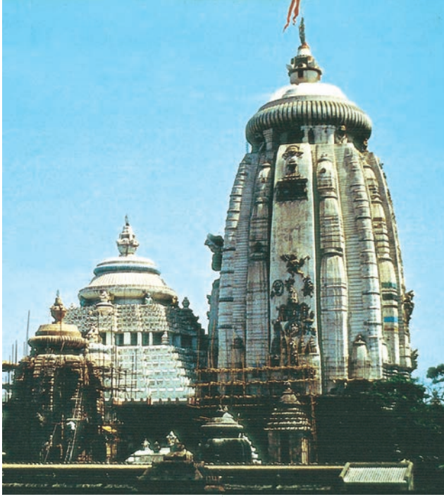
चित्र 3 जगन्नाथ मंदिर, पुरी

ज्यों-ज्यों इस मंदिर को तीर्थस्थल यानी तीर्थ यात्रा के केंद्र के रूप में महत्त्व प्राप्त होता गया, सामाजिक तथा राजनीतिक मामलों में भी इसकी सत्ता बढ़ती गई। जिन्होंने भी उड़ीसा को जीता, जैसे मुगल, मराठे और अंग्रेजी ईस्ट इंडिया कंपनी, सबने इस मंदिर पर अपना नियंत्रण स्थापित करने का प्रयत्न किया। वे सब यह महसूस करते थे कि मंदिर पर नियंत्रण प्राप्त करने से स्थानीय जनता में उनका शासन स्वीकार्य हो जाएगा।