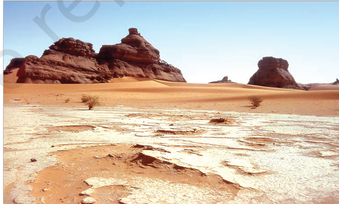
चित्र 9.1 : सहारा रेगिस्तान

विश्व एवं अफ्रीका महाद्वीप के मानचित्र को देखिए। उत्तरी अफ्रीका के बड़े भू-भाग पर फैले सहारा के रेगिस्तान का पता लगाएँ। यह विश्व का सबसे बड़ा रेगिस्तान है। यह लगभग 8.54 लाख वर्ग किलोमीटर के क्षेत्र में फैला हुआ है। क्या आपको याद है कि भारत का क्षेत्रफल 32.8 लाख वर्ग किलोमीटर है? सहारा रेगिस्तान ग्यारह देशों से घिरा हुआ है। ये देश हैं-अल्जीरिया, चाड, मिस्र, लीबिया, माली, मौरितानिया, मोरक्को, नाइजर, सूडान, ट्यूनिशिया एवं पश्चिमी सहारा।