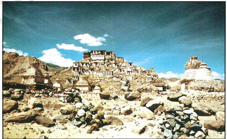
चित्र 9.5 : थिकसे मठ

ग्रीष्म ऋतु में यहाँ के निवासी जौ, आलू, मटर, सेम एवं शलजम की खेती करते हैं। शीत ऋतु में जलवायु इतनी कष्टकारी होती है कि लोग धार्मिक अनुष्ठानों एवं उत्सवों में अपने आपको व्यस्त रखते हैं। यहाँ की महिलाएँ अत्यधिक परिश्रमी होती हैं। वे केवल घर एवं खेतों में ही काम नहीं करती बल्कि छोटे व्यवसाय एवं दुकानें भी संभालती हैं। लद्दाख की राजधानी लेह, सड़क एवं वायुमार्ग द्वारा भलीभाँति जुड़ी हुई है। राष्ट्रीय राजमार्ग-1ए लेह को जोजीला दर्रा होते हुए कश्मीर घाटी से जोड़ता है। क्या आप हिमालय के कुछ अन्य दर्रा के बारे में बता सकते हैं?