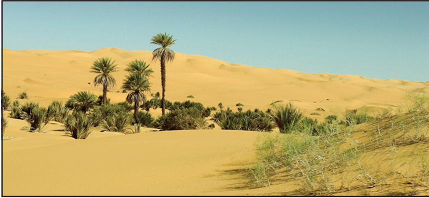
चित्र 9.3 : सहारा रेगिस्तान में मरूद्यान

ऊँट, लकड़बग्घा, सियार, लोमड़ी, बिच्छू, साँपों की विभिन्न जातियाँ एवं छिपकलियाँ यहाँ के प्रमुख जीव-जंतु हैं।