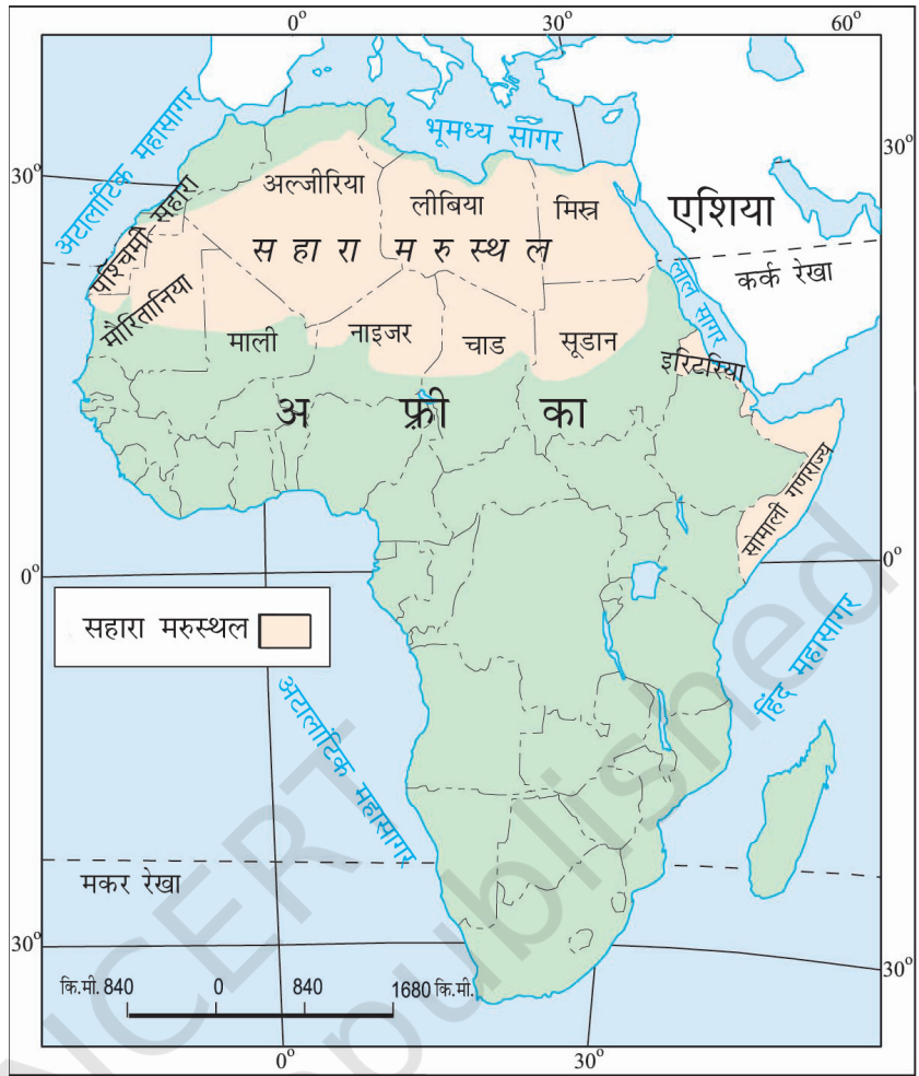
चित्र 9.2 : अफ्रीका महाद्वीप में सहारा

आपको यह जानकर आश्चर्य होगा कि आज का सहारा रेगिस्तान एक समय में पूर्णतया हरा-भरा मैदान था। सहारा की गुफ़ाओं से प्राप्त चित्रों से ज्ञात होता है कि यहाँ नदियाँ तथा मगर पाए जाते थे। हाथी, शेर, जिराफ़, शतुरमुर्ग, भेड़, पशु तथा बकरियाँ सामान्य जानवर थे। परंतु यहाँ के जलवायु परिवर्तन ने इसे बहुत गर्म व शुष्क प्रदेश में बदल दिया है।