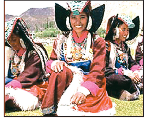
चित्र 9.6 : पारंपरिक वेशभूषा में लद्दाखी महिलाएँ

आधुनिकीकरण के फलस्वरूप यहाँ के जनजीवन में परिवर्तन आ रहा है। लेकिन लद्दाख के लोगों ने शताब्दियों से प्रकृति के साथ समन्वय एवं संतुलन करना सीखा है। जल एवं ईंधन जैसे संसाधनों की कमी के कारण ये आवश्यकतानुसार एवं मितव्ययिता से ही इनका उपयोग करते हैं और कुछ भी व्यर्थ नहीं करते।