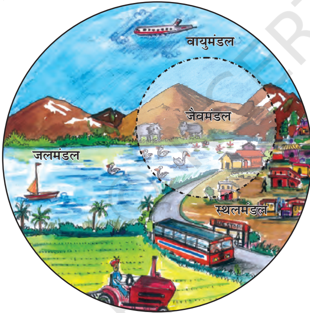
चित्र 1.2 : पर्यावरण के क्षेत्र

स्थलमंडल वह क्षेत्र है, जो हमें वन, कृषि एवं मानव बस्तियों के लिए भूमि, पशुओं को चरने के लिए घासस्थल प्रदान करता है। यह खनिज संपदा का भी एक स्रोत है।