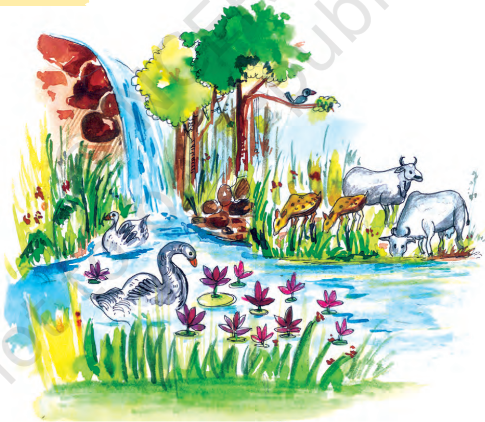
चित्र 1.3 : एक ताल का पारितंत्र