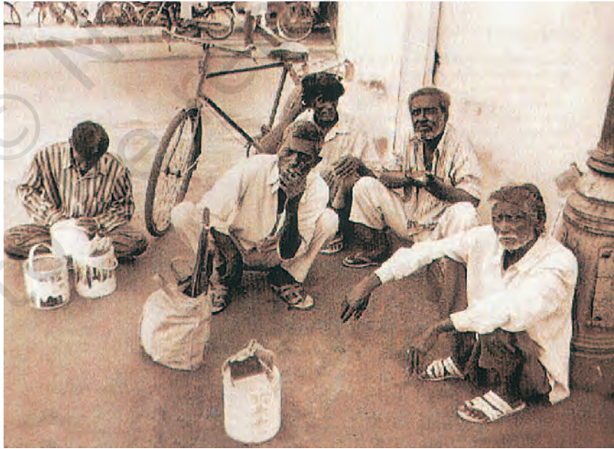
लेबर चौक पर दिहाड़ी मज़दूर अपने औज़ारों के साथ बैठकर लोगों का इंतज़ार करते हैं। लोग उन्हें काम करवाने के लिए वहीं से ले जाते हैं।

हम फैक्ट्री में घुसे तो हमने पाया कि वहाँ अलग-अलग काम के लिए अलग-अलग विभाग थे। उनमें ऐसा लग रहा था कि लोगों की कभी न खत्म होने वाली पंक्तियाँ थीं। जहाँ कपड़े सिले जा रहे थे उस विभाग में हमने देखा कि लोग छोटे से कमरे में मशीनों पर काम कर रहे थे। एक-एक व्यक्ति एक-एक सिलाई की मशीन पर लगा हुआ था और हर कमरे में ऐसी बहुत सारी मशीनें थीं। जो कपड़े तैयार हो रहे थे वे कमरे में एक तरफ तह कर के लगाए जा रहे थे।