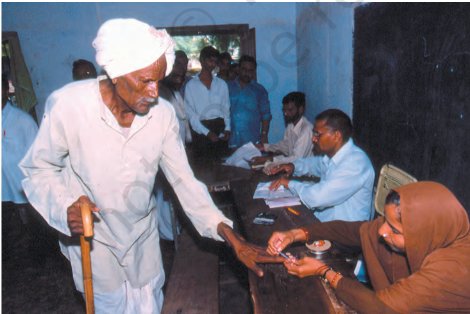
मतदान के समय मतदाता की उँगली पर स्याही से निशान लगाया जाता है ताकि वह केवल एक वोट दे सके – ग्रामीण मतदान केंद्र का दृश्य

लोकतंत्र में मूलभूत विचार यह है कि लोग नियमों को बनाने में भागीदार बनकर खुद ही शासन करें। आज के समय में लोकतांत्रिक सरकार को प्रायः प्रतिनिधि लोकतंत्र कहते हैं। प्रतिनिधि लोकतंत्र में लोग सीधे भाग नहीं लेते हैं, बल्कि चुनाव की प्रक्रिया के द्वारा अपने प्रतिनिधि को चुनते हैं। ये प्रतिनिधि मिलकर