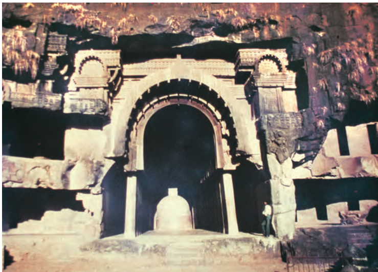
कार्ले की गुफा, महाराष्ट्र

व्यापारी काफ़िलों में तथा जहाज़ों पर दूर-दूर जाया करते थे। बहुत-से तीर्थयात्री भी उनके साथ यात्रा पर निकल पड़ते थे।