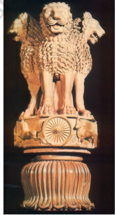
शेरों वाला स्तंभ-शीर्ष

अशोक जिस साम्राज्य पर शासन करते थे उसकी स्थापना उनके दादा चन्द्रगुप्त मौर्य ने लगभग 2300 साल पहले की थी। चाणक्य या कौटिल्य नाम के एक बुद्धिमान व्यक्ति ने चन्द्रगुप्त की सहायता की थी। चाणक्य के कई विचार हमें अर्थशास्त्र नाम की किताब में मिलते हैं।