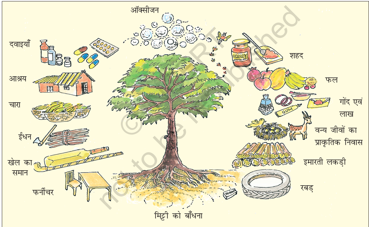
चित्र 8.2: वनों के उपयोग

लीला के माता-पिता ने उसके जन्म पर नीम के एक पौधे को रोपा। प्रत्येक जन्मदिन पर उन्होंने अलग-अलग पौधों को रोपा था। इनको हमेशा पानी से सींचा जाता था तथा अत्यधिक गर्मी, सर्दी एवं जानवरों से बचाया जाता था। बच्चे भी यह ध्यान रखते थे कि कोई उन्हें नुकसान न पहुँचा पाए। जब लीला 20 वर्ष की हुई तब 21 सुंदर वृक्ष उसके घर के चारों ओर खड़े थे। चिड़ियों ने उन पर अपना घोंसला बना लिया था, फूल खिलते थे, तितलियाँ उनके चारों ओर मंडराती थीं, बच्चों ने उनके फलों का आनंद लिया था, उनकी शाखाओं पर झूले तथा उनकी छाया में खेले थे।