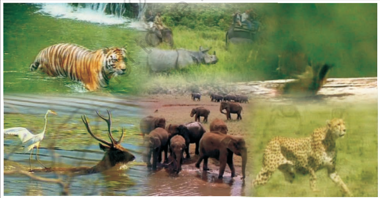
चित्र 8.3 : वन्य जीवन

वनों के कटने तथा जानवरों के शिकार के कारण भारत में पाए जाने वाले वन्यजीवों की प्रजातियाँ तेज़ी से घट रही हैं। बहुत सी प्रजातियाँ तो समाप्त भी हो चुकी हैं। उनको बचाने के लिए बहुत से नेशनल पार्क, पशुविहार तथा जीवमंडल आरक्षित क्षेत्र स्थापित किए गए हैं। सरकार ने हाथियों तथा बाघों को बचाने के लिए बाघ परियोजना एवं हस्ति परियोजना जैसी परियोजनाओं को शुरू किया है। क्या आप भारत के कुछ पशुविहारों के नाम तथा मानचित्र पर उनकी स्थिति बता सकते हैं?