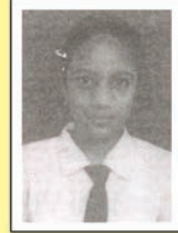
पंखुड़ी विद्या कक्षा VIII B