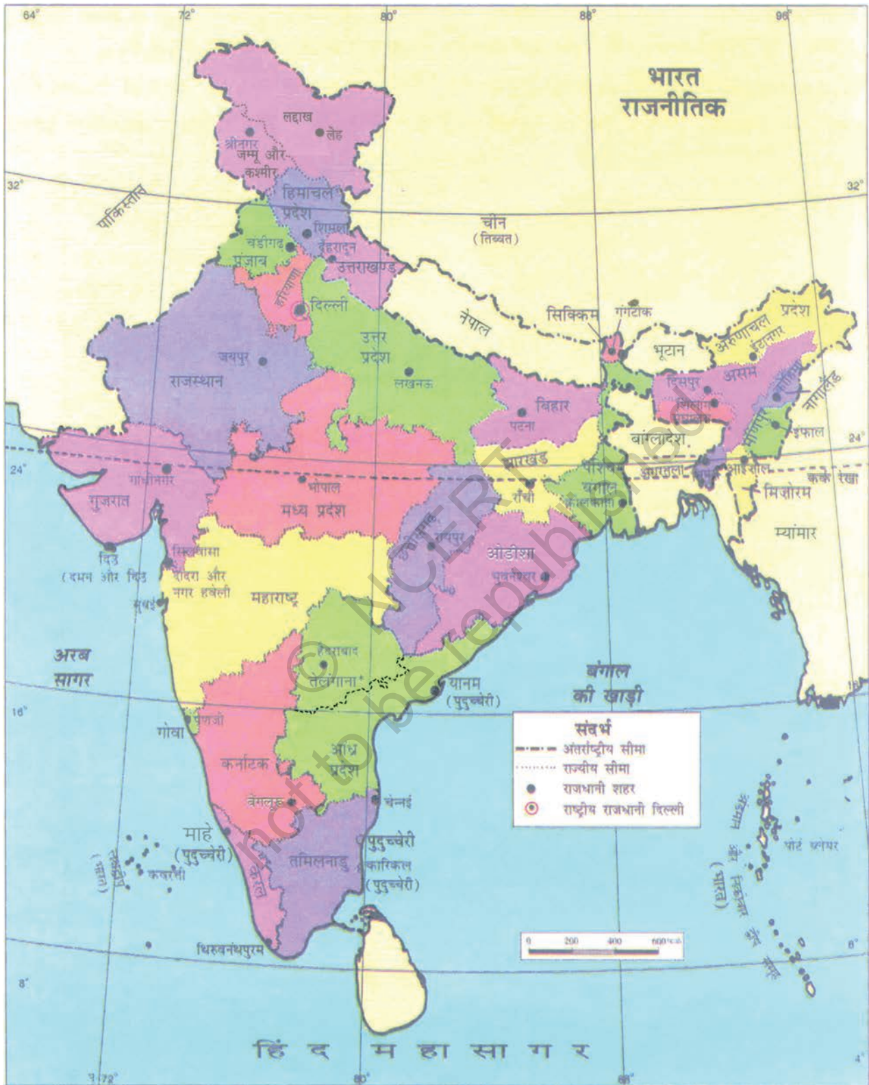
चित्र 7.2 : भारत का राजनीतिक मानचित्र

* जून 2014 में तेलंगाना भारत का 29वाँ राज्य बना