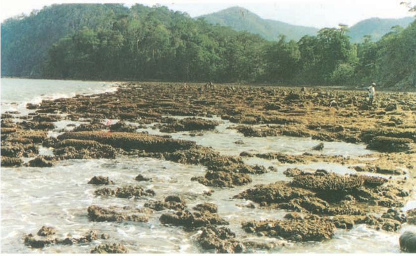
चित्र 7.4 : प्रवाल द्वीप